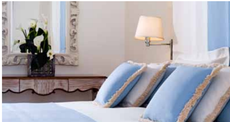
Superior Room - Park