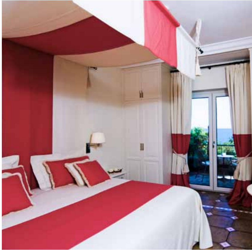
Classic Room - Park