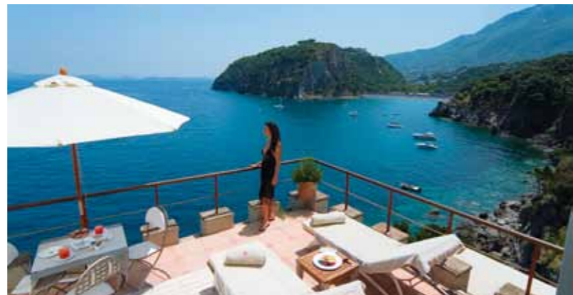
Deluxe Bellevue Suite - Tower