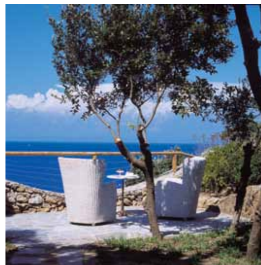
Deluxe Bungalow Family Suite - Park