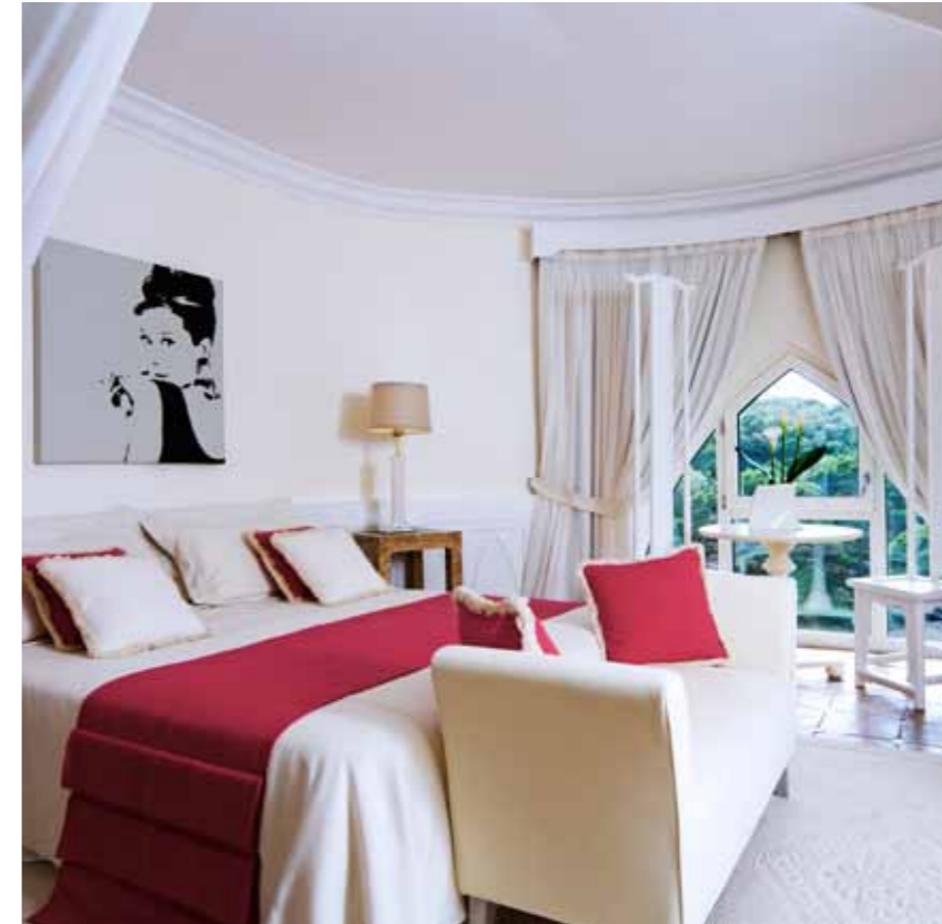
Classic Suite - Tower